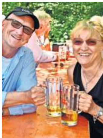
Erholung vom Alltagsstress: das bieten jetzt wieder die Rohrer Waldfeste.

Die Ski-Zunft Rohr hat das Vergnügen, den Reigen der Rohrer Waldfeste am Sonntag und Montag, 10./11. Juni, zu eröffnen. Dann wird es bis zum August noch weitere viermal auf der Rohrer Höhe einen Festbetrieb geben – egal, bei welchem Wetter: ein Festzelt bietet den Gästen Schutz vor Wind und Regen. Die Tradition der Rohrer Waldfeste reicht zurück bis ins ausgehende 19. Jahrhundert. Die Idee stammt vom damaligen Männergesangsverein. Inzwischen sind es fünf Vereine, die auf dem Festgelände an unterschiedlichen Terminen bewirten und die ganze Bevölkerung dazu einladen. Längst gibt es nicht wie zu den Anfängen nur Bier und Rote Wurst. Die Vereine bieten heute Speisen- und Getränkekarten, die wenig Wünsche unerfüllt lassen. Ob Spanferkel, Gockele vom Grill oder Tellersülze: jeder Verein bemüht sich, seinen Gästen besondere Leckereien zu kredenzen. Und bei den Getränken darf's gerne auch mal ein Cocktail sein.