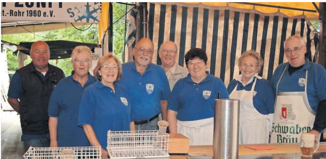
Routinierte Gastgeber: Die Ski-Zunft Rohr ist schon seit vielen Jahrzehnten dabei, hier ein Foto aus dem Jahr 2014.

Zu den Sommer-Aktivitäten gehört freilich auch das Rohrer Waldfest. An beiden Tagen werden etliche der insgesamt 286 Mitglieder des 1960 gegründeten Vereins tatkräftig mithelfen und den Festgästen kalte Getränke und Kaffee reichen. Hungrig muss auch niemand auf den Bierbänken sitzen. Es werden der Grill angeheizt, Pommes frittiert und Crêpes gebacken – und Kuchen gibt es selbstverständlich auch.