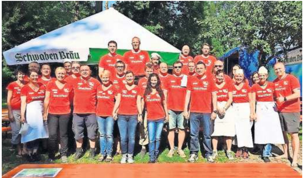
Freuen sich auf viele Waldfest-Gäste: die Europapokalfreunde Vaihingen.

Der runde Geburtstag wird am Waldfest-Montag mit einem kulinarischen Highlight gefeiert – es gibt Spanferkel! „So lange der Vorrat reicht“, wie Stephan sagt.