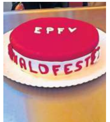
Der VfB-Fanclub kann auch kreativ: Eine Torte zum Waldfest. tk

Dass dabei nicht nur, aber sicherlich auch über Fußball und natürlich auch den VfB gefachsimpelt werden wird, steht außer Frage. Schließlich hat der Stuttgarter Fußballclub in seiner ersten Saison nach dem Wiederaufstieg einen sehr guten siebten Platz belegt und ist leider knapp an der Teilnahme an einem europäischen Wettbewerb gescheitert – über die sich nicht nur die Mitglieder des 2008 gegründeten Europapokalfreunde Vereins gefreut hätten.