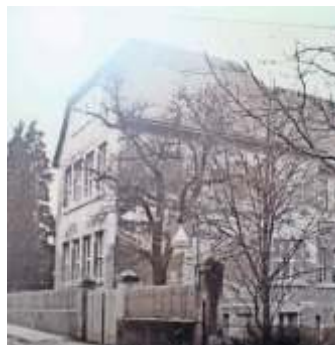
Vereinshaus Alte Rohrer Schule.