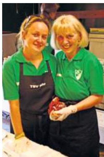
Beim Waldfest zu helfen, macht auch Spaß.