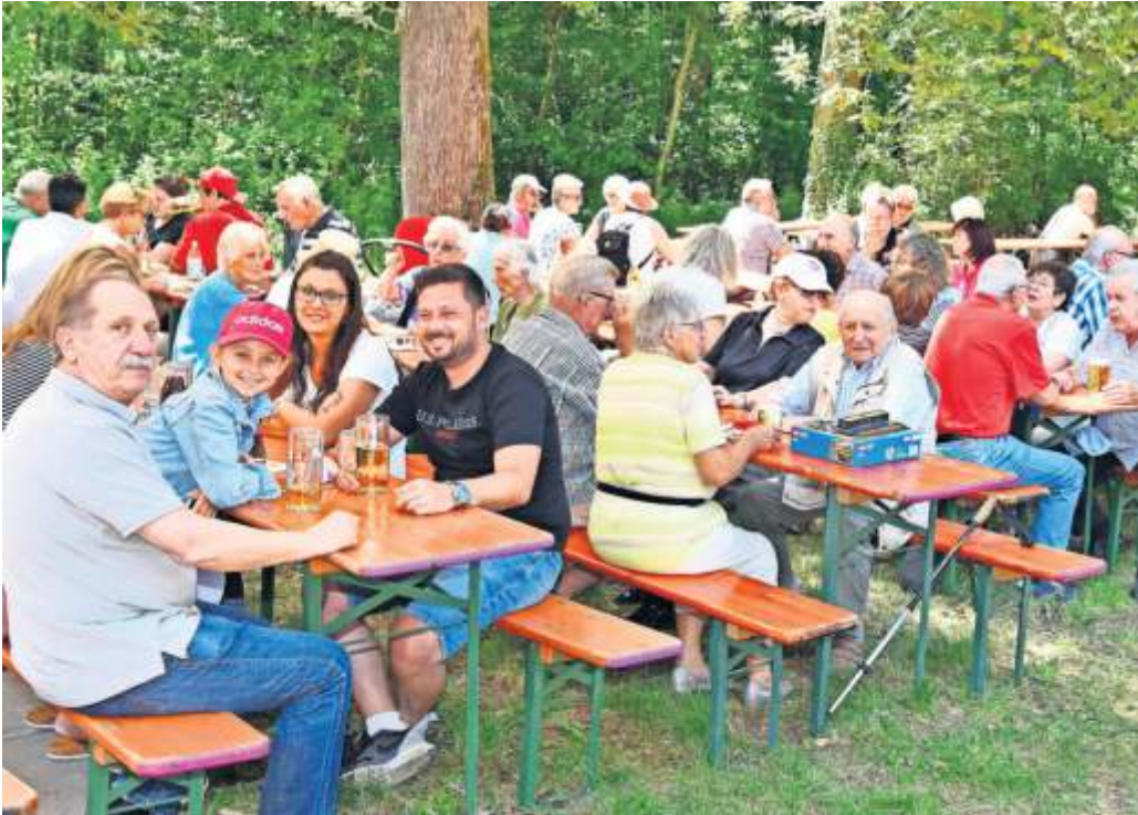
Ein Fest für die ganze Familie unter Schatten spendenden Bäumen: dazu laden fünf Vereine in den nächsten Wochen auf die Rohrer Höhe ein.