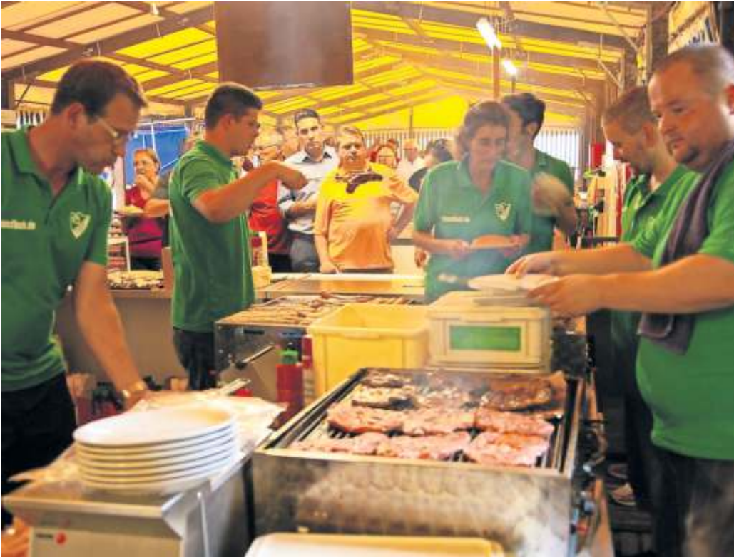
Deftiges vom Grill bietet der TSV Rohr seinen Waldfestgästen. Um den Ansturm zu bewältigen, braucht es viele fleißige Hände.