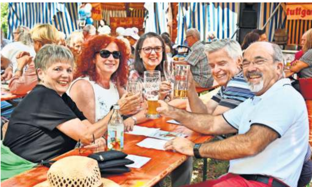
Ein Prosit der Gemütlichkeit – bei den Waldhexen eine Selbstverständlichkeit.

Klar, dass die Narrenzunft mit Hutteneichenerweckung, Hexentaufe, Hexenball, Auftritten, Umzügen und Schulsturm besonders im Winter aktiv ist. Doch sie beweist mit dem Waldfest, dass sie auch bei höheren Temperaturen nicht in den Sommerschlaf fällt. tk