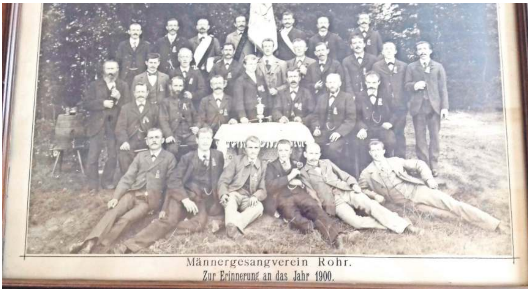
Der Männergesangsverein (MGV) Rohr beim Waldfest auf der Rohrer Höhe im Jahr 1900. Das erste Waldfest im Sonntagsanzug fand am Sonntag, 15. August 1897 statt. Der MGV, gegründet 1842, hatte damals die Idee.