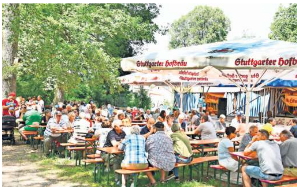
Heutzutage ist die Kleiderordnung auf der Rohrer Höhe entschieden legerer als zu den Anfangszeiten, im Sonntagsanzug kommt keiner mehr zur Hocketse.