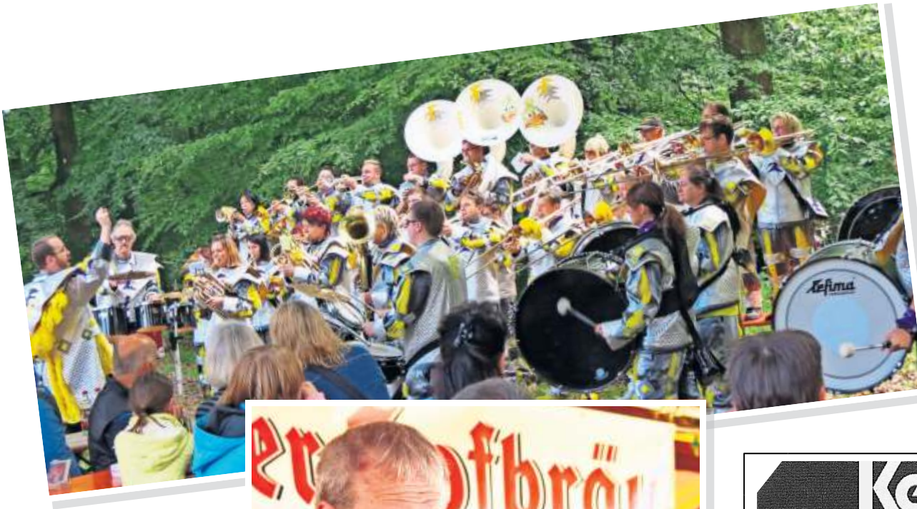
Da bekommt man doch so richtig Lust, mitzufeiern, oder nicht? Also nichts wie hin zu den Rohrer Waldfesten von Juni bis Ende August.