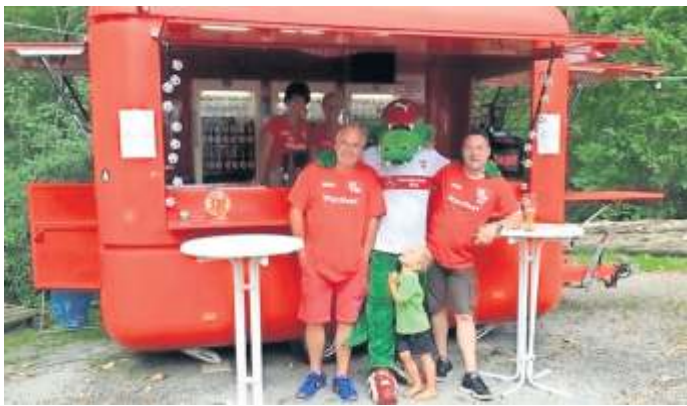
Ob auch das Fritze aufs Waldfest kommt, ist noch ungewiss.

Neben den traditionellen Waldfestgerichten und dem Spanferkel bietet man den Besuchern auch einen Vesperteller, eine Waldfestschokolade und einen Waldfest-Tequila.