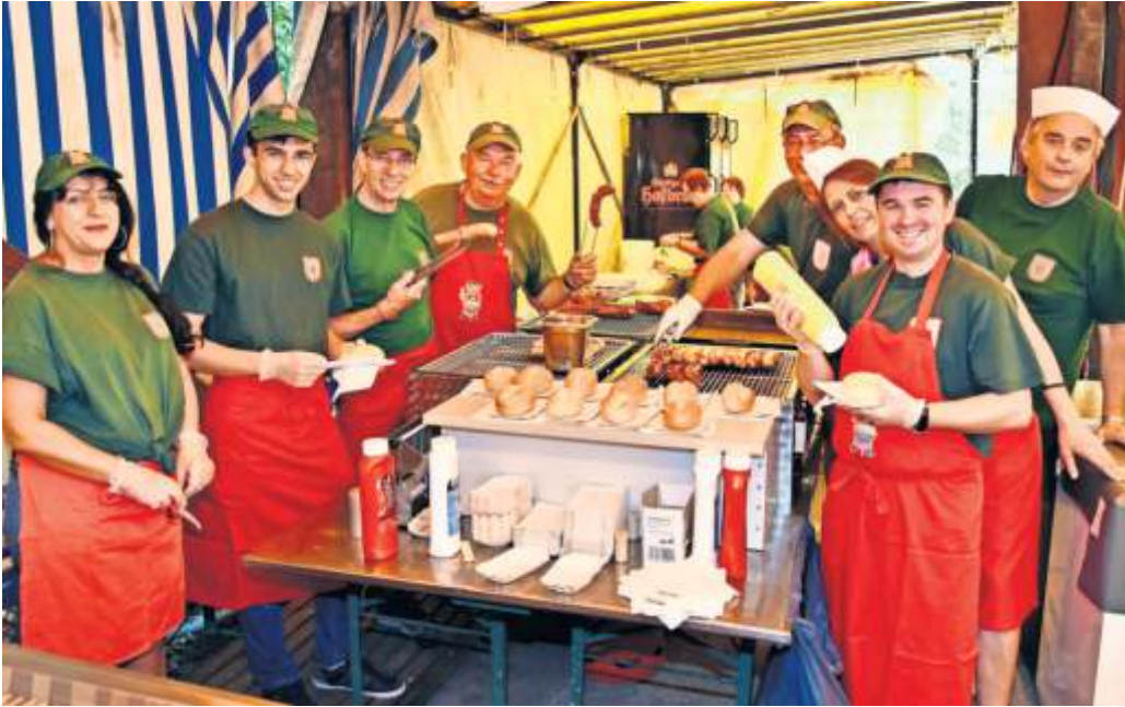
Leckeres aus der Waldfest-Küche versprechen einmal mehr die Rohrer Waldhexen.