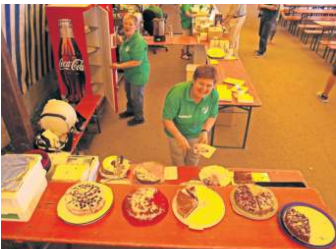
Kaffee und Kuchen dürfen natürlich auch beim Waldfest des TSV Rohr nicht fehlen.