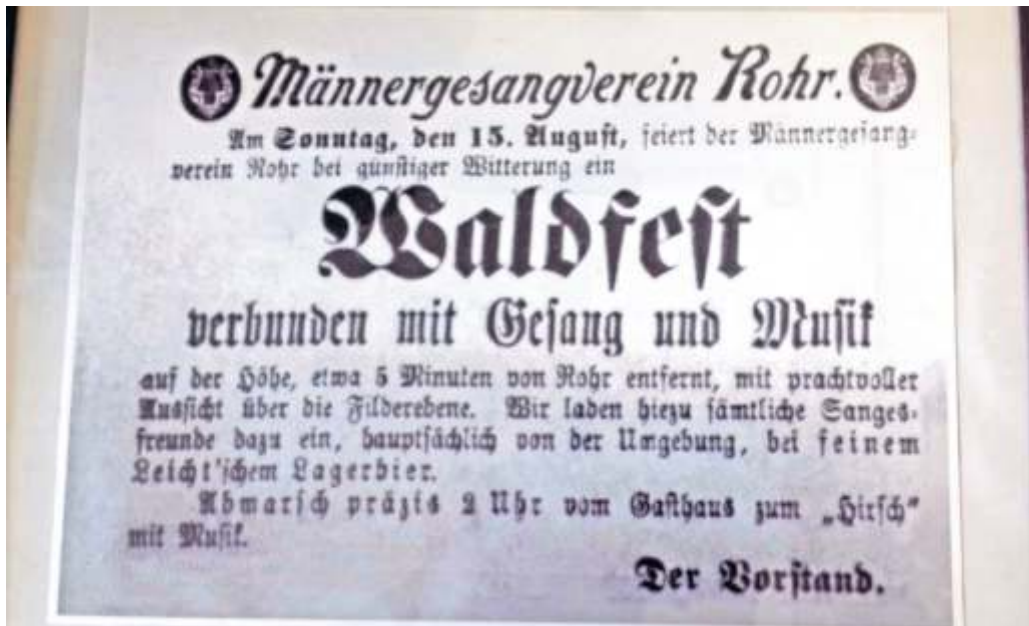
Per Aufruf und öffentlichem Anschlag wurde einst zur zahlreichen Teilnahme an den Waldfesten gebeten. Das Plakat stammt aus der Zeit um 1900.