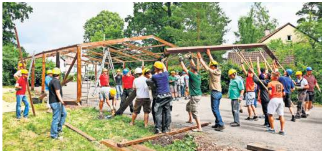
Mit vereinten Kräften: Der Zeltaufbau wird von allen Waldfest-Vereinen gemeinsam gestemmt. Bei Regenschauern finden 200 Personen Unterschupf.