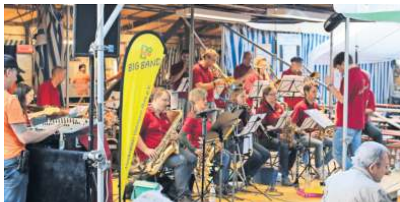
Musikalischer Höhepunkt beim Waldfest des Musikvereins ist der Auftritt der vereinseigenen Big-Band.

Ein weiterer Grund für einen Besuch auf dem Waldfest sind die leckeren, frisch geschlachteten Waldfest-Göckele, „die nirgendwo anders so schmecken wie bei uns“, meint Słupek. Neben dieser kulinarischen Besonderheit stehen aber auch Rote Wurst und Bratwurst, Schweinehals und Pommes auf dem Speisezettel. „In diesem Jahr werden wir zum ersten Mal ein Waldfestmenü anbieten, welches